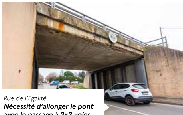
Rue de l'Égalité Nécessité d'allonger le pont avec le passage à 2x2 voies