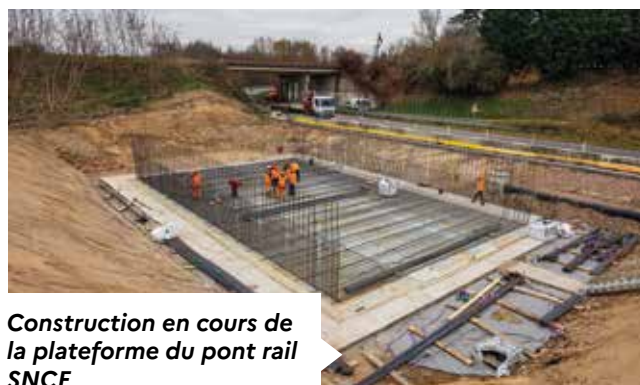
Construction en cours de la plateforme du pont rail SNCF