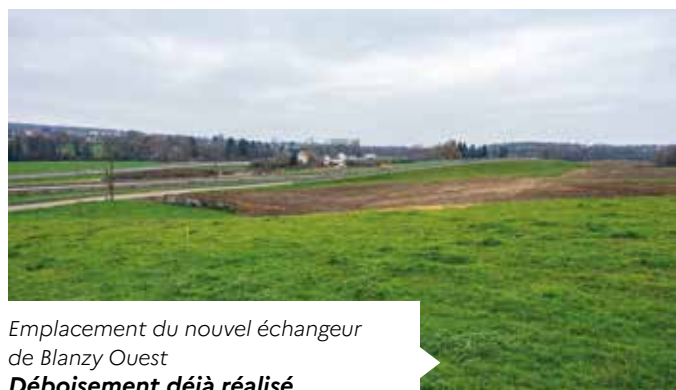
Emplacement du nouvel échangeur de Blanzay Ouest Déboisement déjà réalisé

Pour la conception du projet, les choix effectués tant sur le plan technique qu'organisationnel, ont été guidés par la volonté de mettre au point une opération dans le cadre de la démarche Eviter, Réduire, Compenser. En phase chantier, un coordinateur environnemental accompagne les entreprises pour veiller au respect des obligations réglementaires en matière d'environnement.