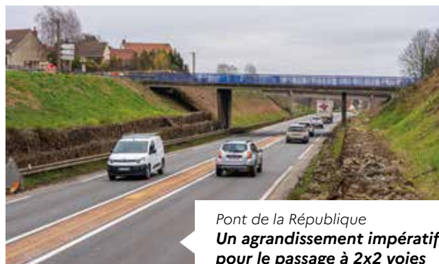
Pont de la République Un agrandissement impératif pour le passage à 2x2 voies