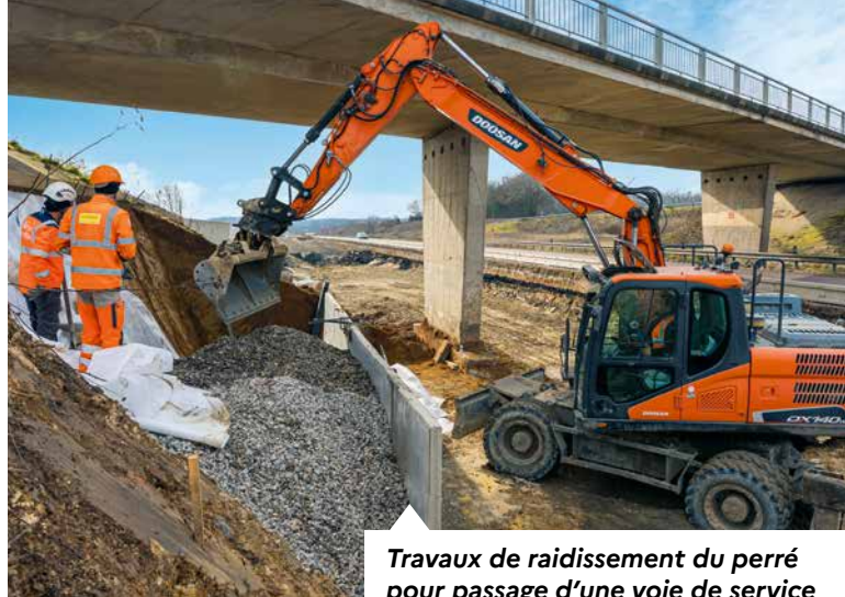
Travaux de raidissement du perré pour passage d'une voie de service