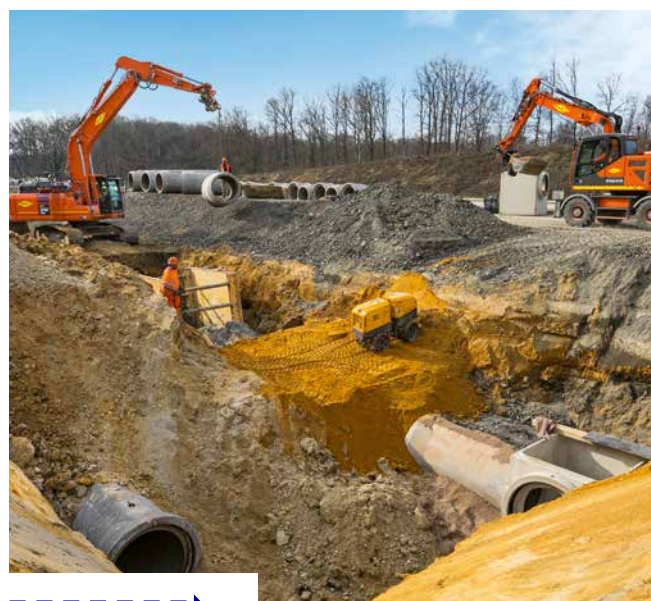
Le chantier va s'organiser jusqu'en juillet 2024 sur une période de 24 mois.