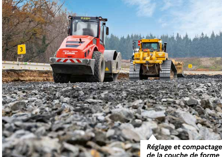
Réglage et compactage de la couche de forme