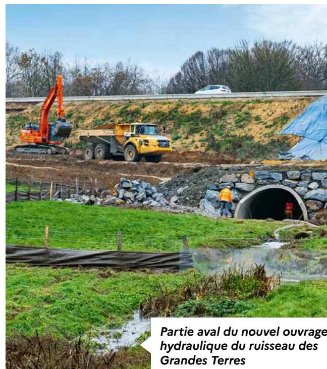
Partie aval du nouvel ouvrage hydraulique du ruisseau des Grandes Terres