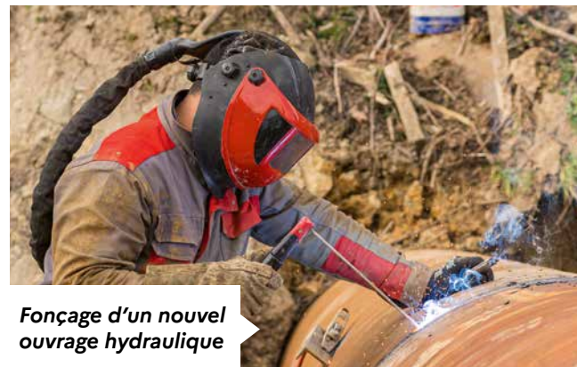
Fonçage d'un nouvel ouvrage hydraulique