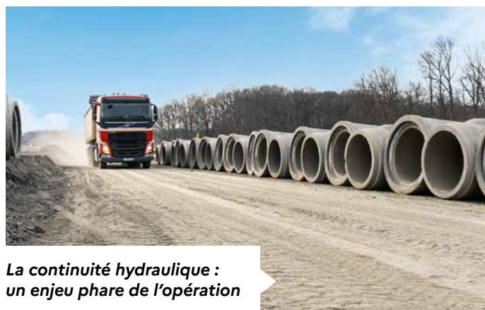
La continuité hydraulique : un enjeu phare de l'opération

Pour la conception du projet, les choix effectués tant sur le plan technique qu'organisationnel, ont été guidés par la volonté de mettre au point une opération dans le cadre de la démarche Eviter, Réduire, Compenser. En phase chantier, un coordinateur environnemental est tenu d'accompagner les entreprises pour veiller au respect des obligations réglementaires en matière d'environnement.